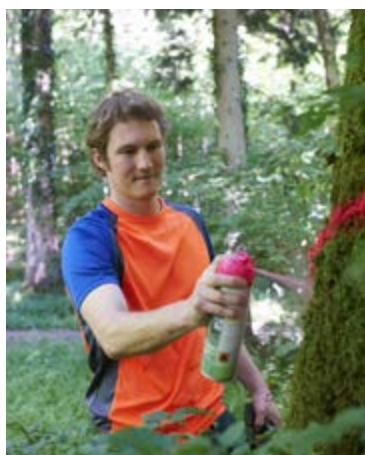
Der Förster entscheidet, welche Bäume gefällt werden.