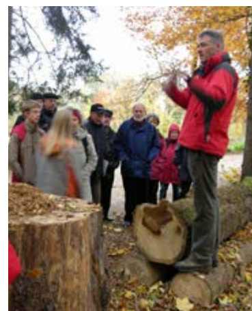
Öffentlichkeitsarbeit ist wichtig. Hier: Information der Anwohner in einem stadtnahen Wald zur Lagerung von Energieholz.