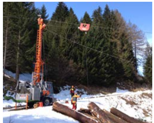
Im Gebirge werden gefällte Bäume mithilfe von Seilkrananlagen an den Lagerplatz transportiert.