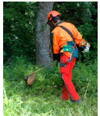
Die Waldrandpflege ist eine ökologische Massnahme, die u.a. vom Forstwart ausgeführt wird.