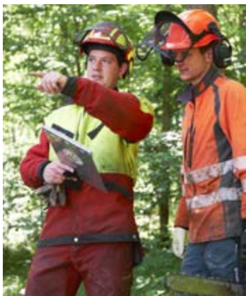
Ein Gruppenleiter weist einem Forstwart die Arbeit zu.