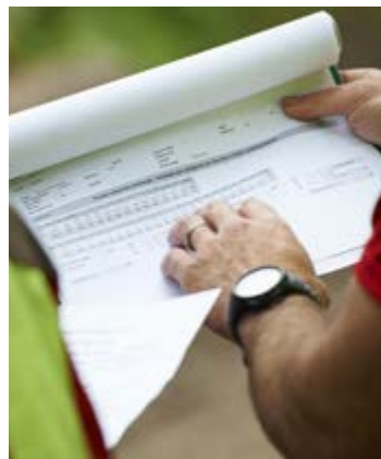
Vorarbeiter sind für einen grossen Teil der Arbeitsorganisation zuständig.