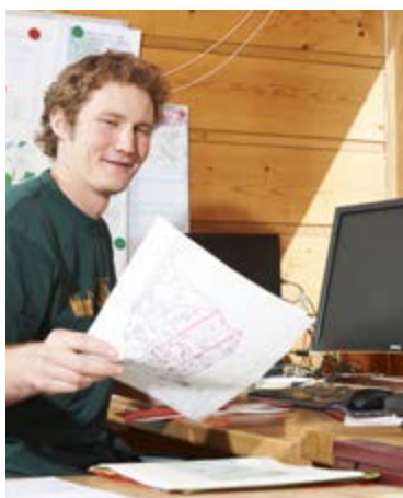
Auch Planungs- und administrative Arbeiten im Büro gehören zum Arbeitsalltag des Försters.

Der Försterberuf wandelt und erweitert sich im Umfeld von gesellschaftlichen, wirtschaftlichen und ökologischen Veränderungen laufend. Neue Tätigkeitsgebiete finden Förster nicht nur im Wald, sondern auch in walddnahen Bereichen, sei es als Chef eines eigenen Unternehmens, als Führungskraft oder als Berater in der Holzverarbeitungsbranche, in Verwaltungen, Planungsbüros, Verbänden oder Umweltorganisationen. Försterinnen und Förster sind wichtige Vermittler zwischen Waldbesitzern, Behörden und der Öffentlichkeit.