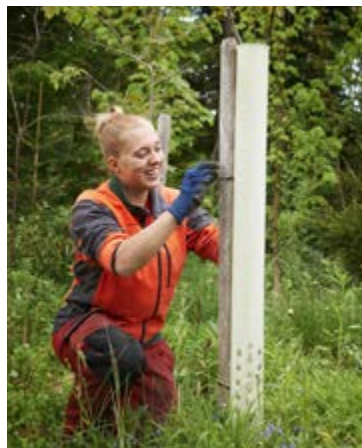
Hier wird ein junger Baum mit einem Verbisschutz aus Kunststoff umhüllt.