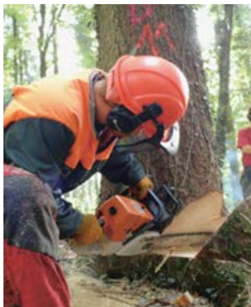
Bäumerfällen ist eine anspruchsvolle und gefährliche Arbeit.

Weil die Unfall- und Gesundheitsrisiken relativ hoch sind, wird sowohl in der Ausbildung als auch im Berufsalltag grosser Wert auf Arbeitssicherheit und Gesundheitsschutz gelegt.